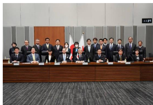
衆参日本・ポーランド友好議員連盟合同会議、大使より、隣国ウクライナ情勢の報告を受けました。