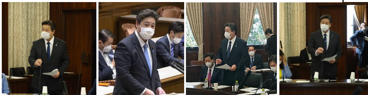
今通常国会では、所属する法務委員会、拉致問題特別委員会、議院運営委員会で数多くの質疑をしています。