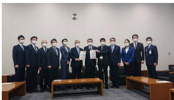
来年行われるG7関係閣僚会議の群馬県誘致に向け、県連国会議員団で松野 官房長官へ要望を行いました。