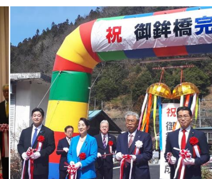
川場村・武尊大橋、みなかみ町・新三国トンネル、神流町・御鉾橋、それぞれ県内重要インフラの完成・開通式典に出席致しました。