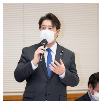
自民党中央政治大学院「まなびと塾」にて、「Well-being」をテーマに意見表明を行いました。