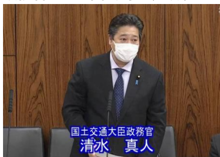
国土交通大臣政務官 清水 真人