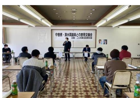
JA利根沼田の若手有志の皆様と、農政の様々な分野において意見交換させて頂きました。