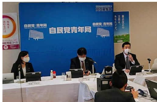
今期より青年局青年部副部長として、青年局定例会議で司会を務めました。