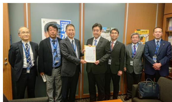
来年度予算編成に向けて、地元の各業界団体の皆様より多くの要望をお聞きしています。