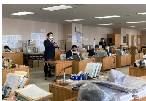
群馬県議会最終日に自民党県議団控室へ訪問、国政報告とご挨拶致しました。