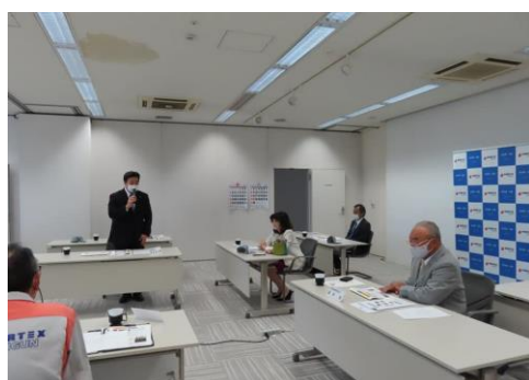
片山 さつき 参議院議員と共に、外国人労働者受け入れ企業の視察と意見交換を致しました。