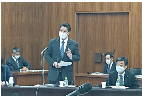
国土交通委員会にて質疑を行い、「GoTo」キャンペーン及び先般の豪雪対応について政府見解を伺いました。