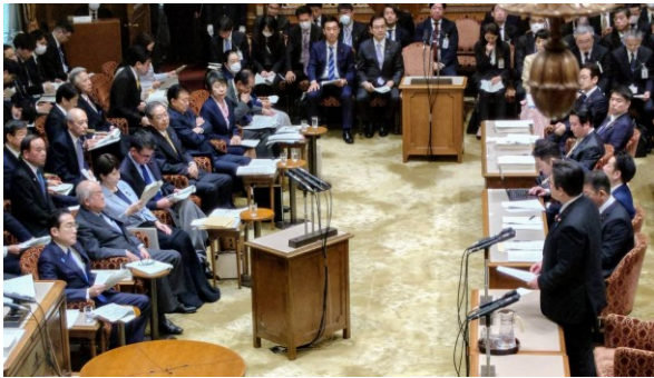
当選以来実質初めて、NHKテレビ放送入りの質疑に立つ。決算委員会にて、総理以下各閣僚に質疑した。