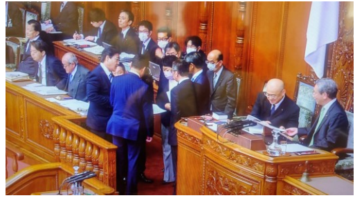
議院運営委員会理事として、本会議場内において、議事進行について他党理事と協議する。