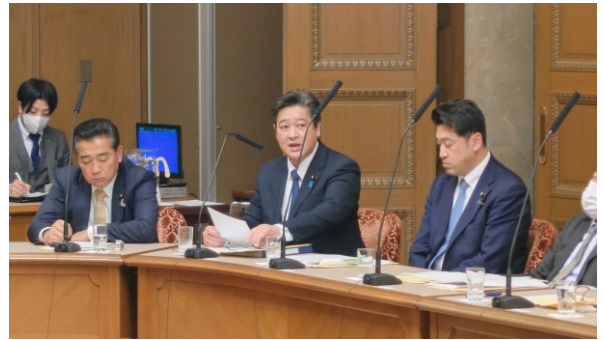
議院運営委員会にて質疑。人事院人事官に就任予定者の所信に対する質疑を行う。