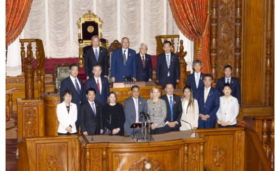
コロンビアより上院議長ご一行様が来日。参議院議長以下、議運理事が接遇対応をした。