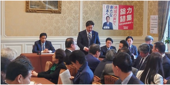
国会対策副委員長として、参議院自民党総会にて本会議の議事について報告する。