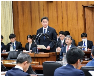
衆・文科委員会で所信挨拶をしました。