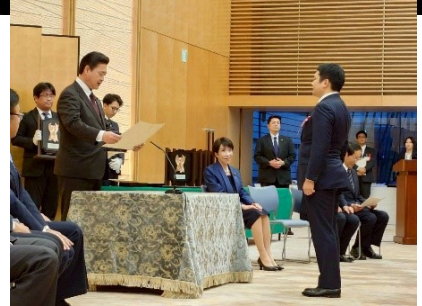
各種式典に、政府の一員として出席しています。