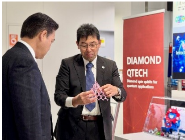
全国各地の関係施設に視察へ行き、現場の課題についての知見を深めています。