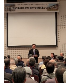
政務官としての在京当番の合間を縫って、地元群馬県での会合などにも積極的に出席しております！