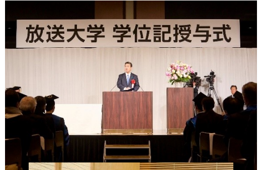
放送大学 学位記授与式