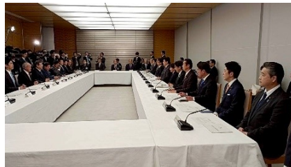
総理官邸で開催された月例経済報告会議に、文部科学省を代表して出席しました。