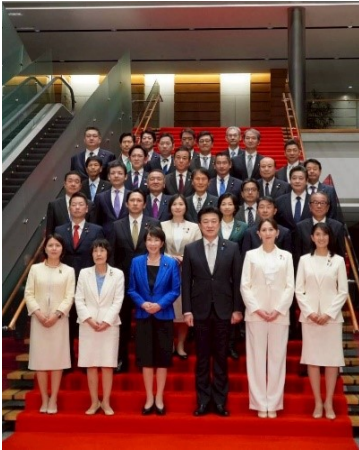
第2次高市内閣においても、引き続き文科・復興政務官を務めます。