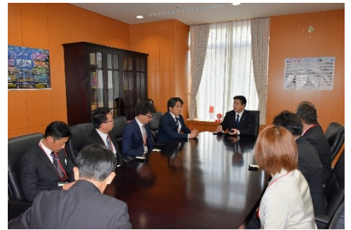
地元群馬をはじめ、多くの関係団体の皆さまがご来省され、様々な意見交換を行っております。